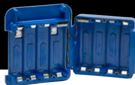
Bloc pour piles alcalines