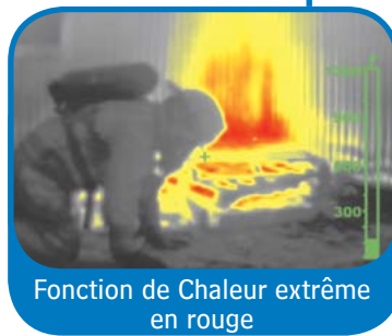
Fonction de Chaleur extrême en rouge

Grâce à la fonctionnalité de Chaleur extrême en rouge, les niveaux de chaleur sont identifiés par des couleurs. Les objets dont la chaleur est extrême, à partir de 260 °C (500 °F), sont teintés en jaune et tournent progressivement au rouge vif lorsque l'intensité de la chaleur augmente. La fonction de Chaleur extrême en rouge révèle les couches thermiques spécifiques afin d'alerter les pompiers concernant les zones de chaleur intense et identifie plus efficacement la propagation du feu.