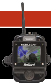
Récepteur portable MobileLink